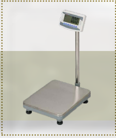
معايرة الميزان سنويًا