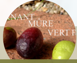
اخضر - ناضج - متحول